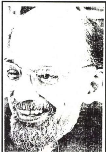
A. Ginsberg képe a Szombat nevű hazai zsidó lapból

Felmerülhet még az a feltevés is, hogy a nyilatkozók megőrültek. Mind a hárman és egyszerre. Mert mással nem magyarázható az az igyekezetük, amelynek eredményeképp sikerült magukat végérvényesen lejártniuk és a nemzeti eszmeiségnek újabb híveket